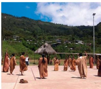
Danse rituelle des Yaneshas - Pérou

La qualité du niveau de langue atteint permet aux élèves de prendre l'espagnol en LV1 en classe préparatoire, même en Hypokhâgne.