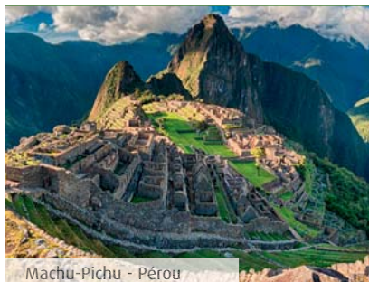
Machu-Pichu - Pérou

C'est un parcours d'excellence, proposé à tous les élèves qui pourront témoigner d'une réelle volonté de s'investir en séries générales et ayant le goût de la littérature en espagnol.