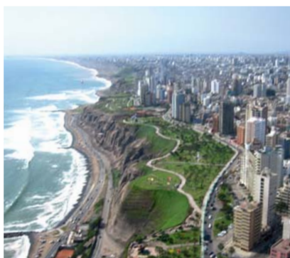
Lima - Pérou