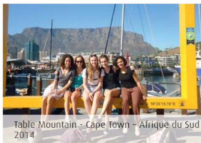
Table Mountain - Cape Town – Afrique du Sud 2014