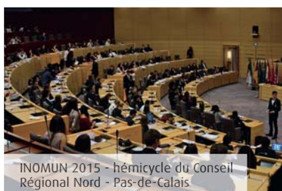
INOMUN 2015 - hémicycle du Conseil Régional Nord - Pas-de-Calais