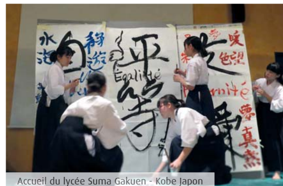
Accueil du lycée Suma Gakuen - Kobe Japon

Des échanges approfondis sur le long terme leur offrent une véritable découverte mutuelle par échanges virtuels ou par immersion.