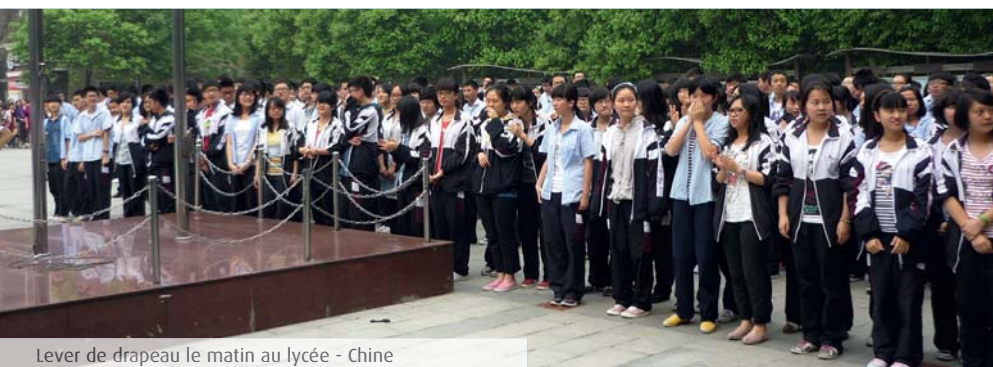
Lever de drapeau le matin au lycée - Chine

Le lycée s'engage dans la démarche CERTILINGUA , pour les deux langues Anglais et Allemand, permettant aux élèves volontaires ayant atteint un niveau B2 dans les deux langues en terminale et sur présentation d'un mémoire retraçant leur expérience de mobilité personnelle, d'obtenir un label européen supplémentaire accolé à leur diplôme du baccalauréat.