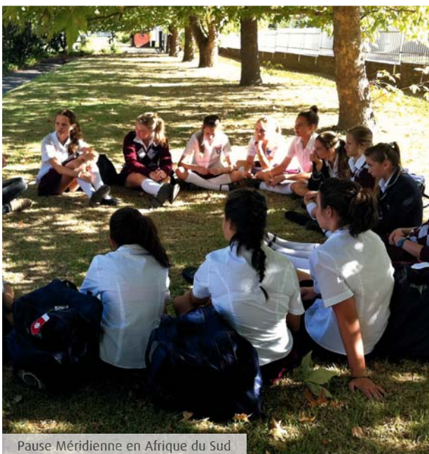
Pause Méridienne en Afrique du Sud