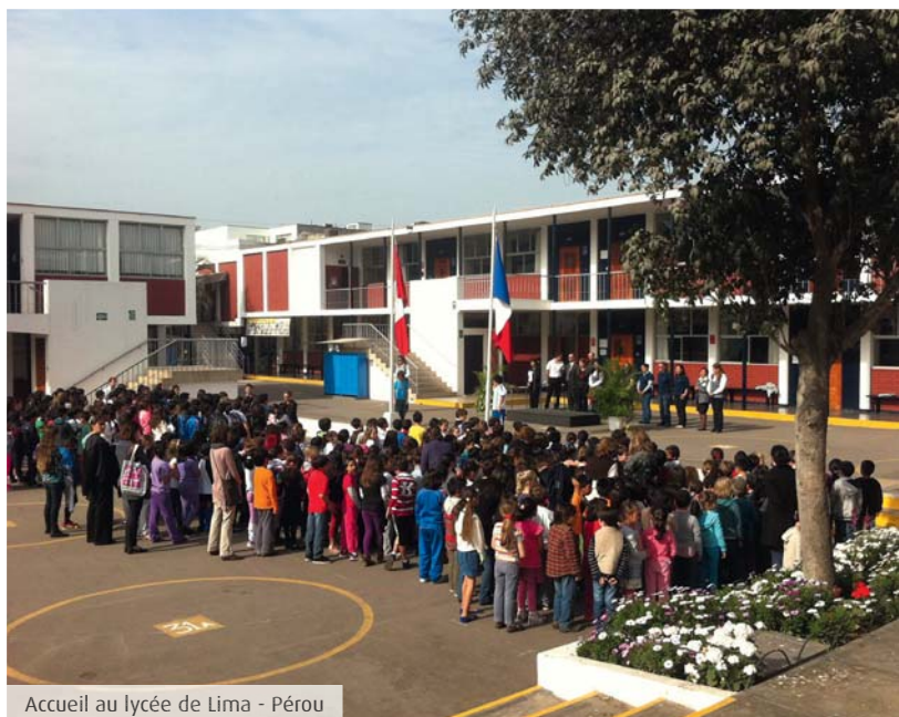
Accueil au lycée de Lima - Pérou